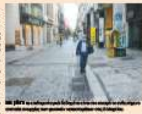
Με 3 «κόφτες» η επαναλειτουργία των εμπορικών καταστημάτων

Το κούρεμα των τραπεζών θα είναι οριζόντιο και θα αφορούν όλους τους κλάδους, με τους κόφτες να μην αφορούν μόνο τα εμπορικά καταστήματα, αλλά και τις επιχειρήσεις που έχουν σχέση με αυτά, όπως οι μεταφορείς, οι ασφαλιστές, οι εργολάβοι κ.λπ.